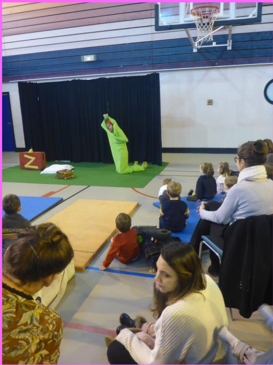
Fête de Noël : enfants et adultes ont assisté au spectacle « Zoé fait la sieste » puis une surprise est venue leur rendre visite