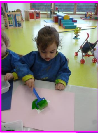
Atelier créatif de Noël