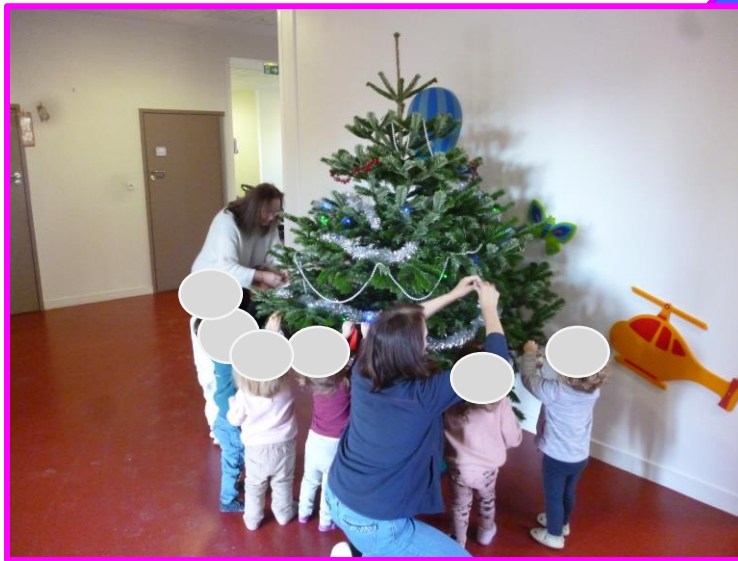
Décoration du sapin de Noël avec la crèche Poisson Lune