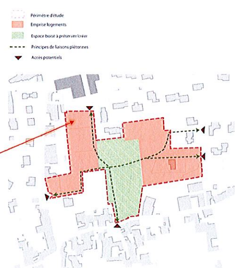
Extrait de l'OAP du secteur 2 du PLU